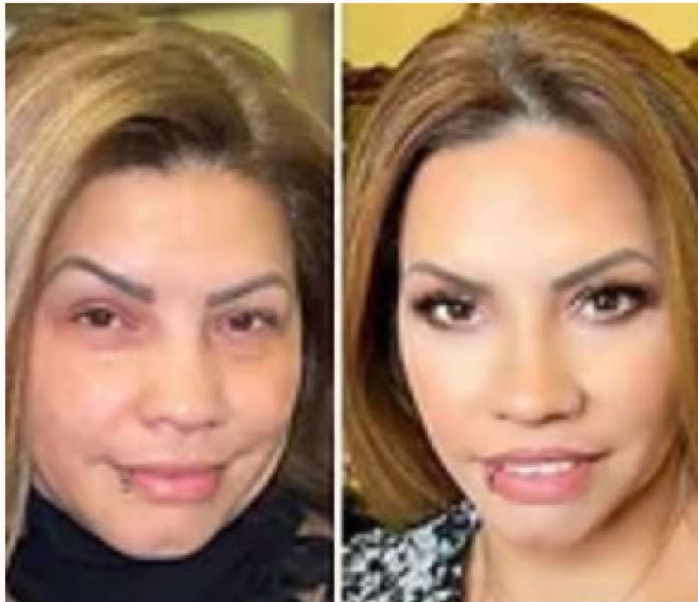
VORHER / NACHHER